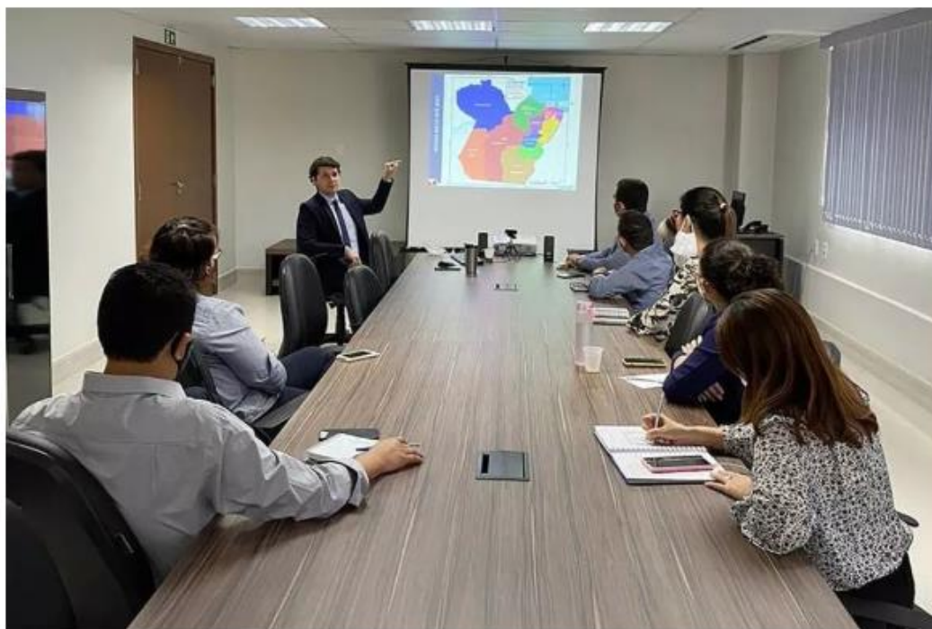
Reunião para planejar instalação de unidade para atendimentos de beneficiários da Igeprev em Santarém, no Pará